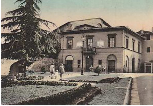
Vecchia immagine del Teatro Garibaldi e della sua piazza

Nel 1860 l'Accademia dei Risorti incaricò l'architetto figlinese Angelo Pierallini di progettare il teatro all'interno dell'antico cassero delle mura