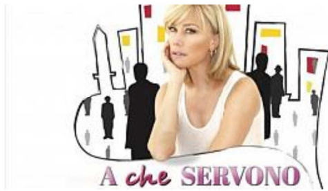
Nancy Brilli protagonista in "A che servono gli uomini?"

"A che servono gli uomini?" vede protagonista della commedia musicale l'attrice che aveva debuttato nel teatro di Figline nel 2001. Le altre presenze