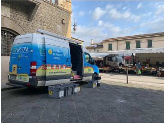
Ecofurgone al mercato di Figline

Ecco dove, quando e in quali ore si può trovare il mezzo di Alia. L'elenco delle sostanze che possono essere conferite dalle utenze domestiche