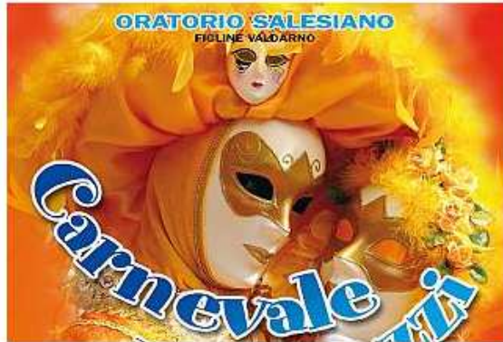
Il manifesto del Carnevale dei Ragazzi a Figline Valdarno

I giorni e le ore in cui viene modificata la circolazione, con rimozione delle auto in divieto di sosta, per consentire il Carnevale dei Ragazzi 2020