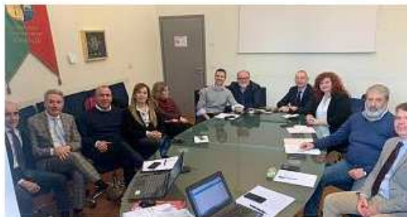
L'incontro tra la Asl e i Comuni del sud est fiorentino

Al termine dell'incontro con l'Azienda sanitaria la sindaca di Figline e Incisa ha fatto il punto su quanto è stato promesso per l'ospedale cittadino