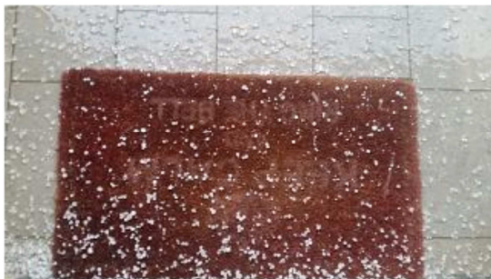
La grandine caduta su Figline Valdarno

Nel pomeriggio di martedì una violenta grandinata, preceduta da una tempesta di vento, ha imbiancato le strade. Il cambiamento meteo era previsto